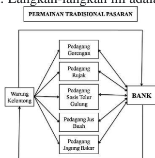
Gambar 2. Konsep Pengembangan

Pengembangan nilai pendidikan kewirausahaan dalam permainan tradisional pasaran akan dikembangkan sesuai dengan langkah-langkah yang telah peneliti uraikan dalam metode penelitian. Langkah-langkah ini adalah