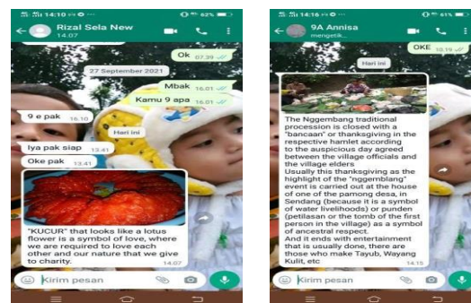
Gambar 3. Hasil tugas teks deskriptif berbasis literasi budaya dan kewargaan dikirim peserta didik ke whatsapp guru.

Pada kegiatan Siklus 2, ternyata banyak peserta didik yang antusias untuk menulis teks Deskriptif. Hal ini dikarenakan, objek yang mereka dapati untuk dikirim sebagai hasil tugas adalah objek yang tidak asing bagi mereka. Dan kegiatan tersebut ( Nggemblang ) sangat dinanti dan dirindukan oleh seluruh warga kampung. Karena acara adat ini diselenggarakan setahun sekali, setelah masa panen tiba. Sehingga, keterampilan menulis teks Deskriptif bagi peserta didik akan meningkat dan kemampuan untuk mengapresiasi, memahami, mengetahui dan menganalisis nilai-nilai budaya dan tradisi kearifan lokal akan tetap tumbuh melalui kegiatan Literasi Budaya dan Kewargaan. Hasil tugas, juga dapat dicetak oleh peserta didik, untuk disetorkan kepada guru, seperti pada gambardi bawah ini