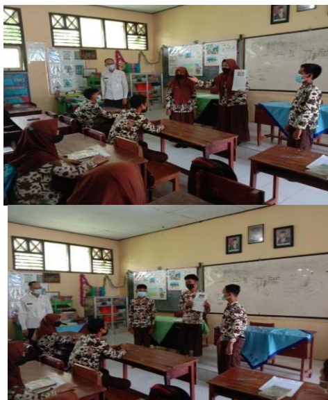
Gambar 2. Suasana pembelajaran di kelas ketika peserta didik mempresentasikan hasil kerja mereka pada siklus 2

Kegiatan berikutnya, setelah semua kelompok selesai memaparkan teks deskriptifnya, lalu guru mulai membimbing peserta didik untuk diarahkan kepada pemahaman dan konsep akan pentingnya berliterasi, khususnya dalam Literasi Budaya dan Kewargaan. Salah satu contoh konkret dalam pembelajaran Bahasa Inggris yang saat ini dilakukan adalah dengan mendeskripsikan tradisi, budaya dan nilai kearifan lokal yang ada di sekitar tempat tinggal peserta didik dengan memanfaatkan penggunaan IPTEK yaitu gawai peserta didik masing-masing. Jadi, skenario dalam penugasan di Siklus 1 adalah peserta didik mendatangi Masyarakat Adat Samin, dimana sedang diselenggarakan Nyadran (Jawa: sedekah bumi). Pada kegiatan Nyadran terdapat tradisi Nggemblang (akronim Jawa : nggembelake sanak kadhang, sing wis pada ilang ) artinya dalam Bahasa Indonesia adalah, merestakan kembali tali persaudaraan yang hampir hilang atau putus. Di kegiatan Nggemblang , dimaknai dengan saling kunjung dan silaturahmi dengan tetangga, sanak saudara dan kerabat. Tidak ketinggalan kuliner dan camilan khas dari Nggemblang tersaji di tiap rumah dan lengkap dengan lauk pauk yang tersedia. Peserta didik yang mendatangi Masyarakat Adat Samin, juga diarahkan guru membawa gawai untuk pendokumentasian teks Deskriptif yang mereka buat. Hasil tugas mereka dapat dilihat dari gambar di bawah