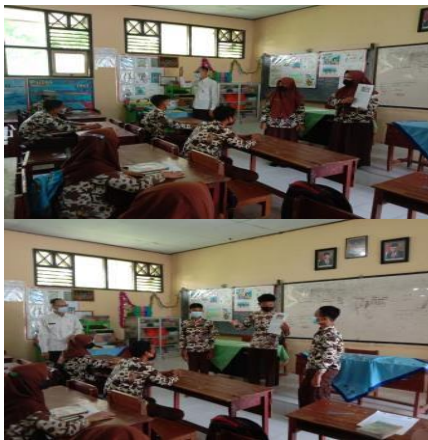
Gambar 1. Suasana pembelajaran di kelas ketika peserta didik mempresentasikan hasil kerja mereka pada Siklus 1

Di kegiatan inti, guru mulai menyampaikan informasi berupa materi pembelajaran yang akan dibahas yaitu mengenai Teks Deskriptif. Di sini guru mulai menjelaskan tujuan pembelajaran yang ingin dicapai bersama, rumus penulisan, ciri kebahasaan, unsur-unsur kebahasaan hingga penggunaannya. Selanjutnya, guru memulai meminta peserta didik untuk menulis teks deskriptif berdasarkan gambar yang disediakan oleh guru (di sini guru bisa membagikan potongan gambar benda apapun di kertas untuk dibagikan di peserta didik). Pada kegiatan ini, peserta didik bekerja dalam kelompok. Tiap kelompok berisi 4-5 orang. Selanjutnya, setelah selesai perwakilan peserta didik tiap kelompok diminta untuk memaparkan hasil menulis teks deskriptifnya di depan kelas seperti pada keterangan gambar di bawah ini.