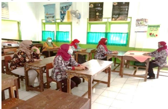
Gambar 2. Kepala sekolah bersama guru merancang Video Pembelajaran

Hasil yang ada pada tabel di atas dapat dilihat bahwa peningkatan kemampuan merencanakan telah mencapai 85%. Peneliti menghentikan penelitian tindakan pada siklus II. Penelitian dianggap telah mencapai indikator kinerja. Kegiatan pada siklus II ini difokuskan pada pembuatan media video pembelajaran pada aspek editing. Salah satu kegiatan pada siklus II dapat dilihat pada gambar berikut.