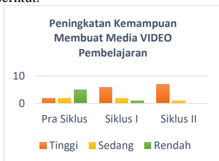
Grafik 2. Grafik Peningkatan Kemampuan Membuat Media Video Pembelajaran Semua Siklus

Peningkatan peningkatan kemampuan membuat media video pembelajaran dapat dilihat pada grafik berikut.