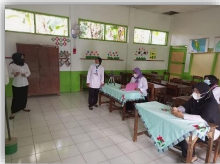
Gambar 1. Kegiatan Pembimbingan oleh Kepala Sekolah

kemampuan kritis siswa. Kegiatan tersebut dapat dilihat pada gambar berikut.